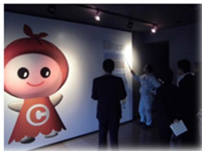
浦安市クリーンセンター（浦安市千鳥）を見学