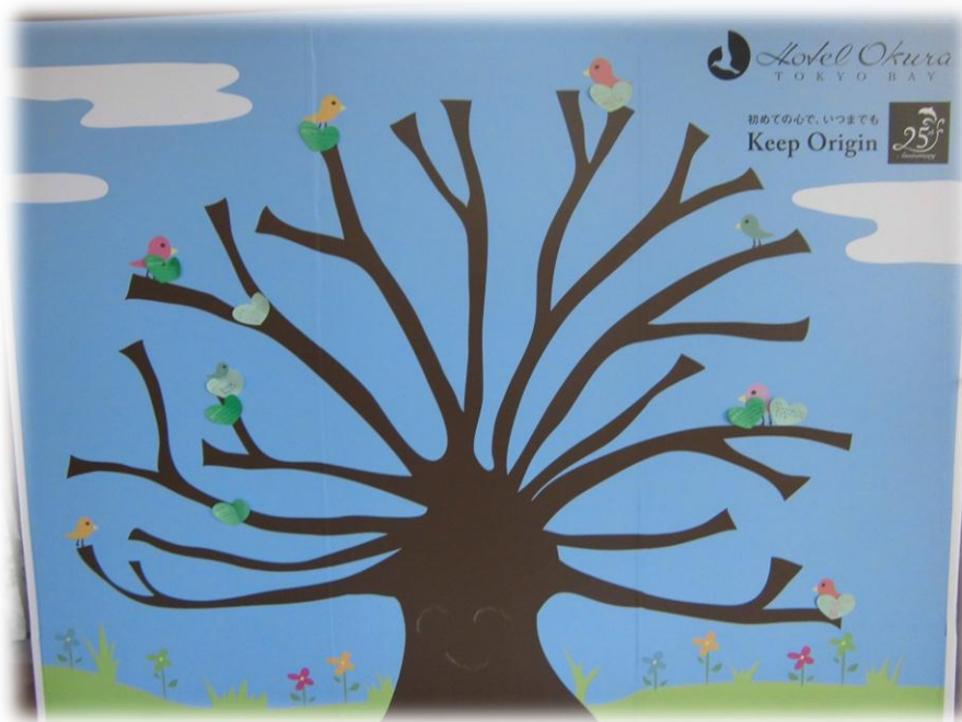
フотスポットの裏側

エコクイズラリーを実施。参加者には、間伐材を使用したエコ鉛筆とエコメッセージカードプレゼント。また、朝食バイキングで食べ残しをしなかったお子様にもエコメッセージカードをプレゼントし、エコについてのメッセージを記入いただき、メッセージボードに貼付、エコメッセージは、市内神社でご祈禱いただきました。