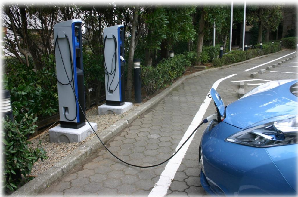
充電スタンドの設置と 電気自動車レンタカー サービス（日産リーフ）