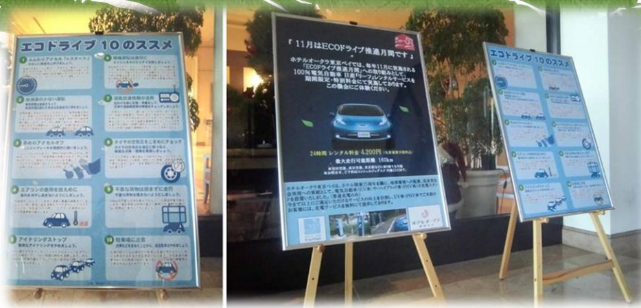
エコドライブ10看板の設置 電気自動車レンタカー看板設置