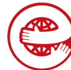
エコマーク認定美容室